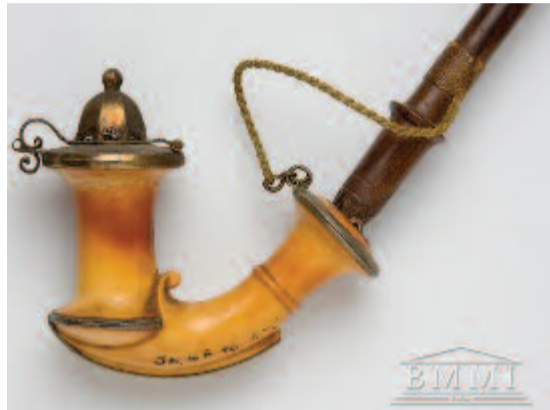
Tajtékpipa, 19. század (jpmweb.jp.hu)

Kitünő írást közölt Oláh-Gál Róbert Bolyai-kutató, egyetemi oktató Bolyai Farkas, Gauss és a pipa címen a Népújság 2017. május 12-i számában. A két illusztráció ez alkalommal is felkeltette az érdeklődésemet a domborműves pipák iránt. A tanár úr kellőképpen megvilágította a pipa szerepét a két jeles tudós szellemi-lelki kapcsolatában. Az alsó illusztrációról megállapítható, hogy az ismeretlen mester ezt a pipát tajtékköből faragta művészi tehetséggel.