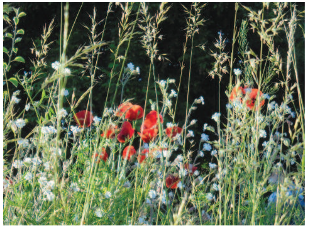
Pipacsos rét június hajnali fényében

De az evolúcióelmélet nem hit vagy hitelenség kérdése. Vallásos ember is elfogadhatja az evolúcióelméletet – vallja Rudolf Langthaler filozófus: „ A Biblia nem nyújt