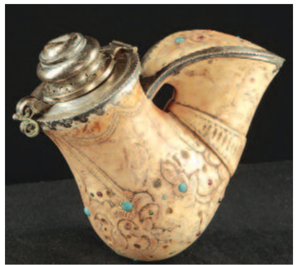
Tajtékpipa Pinter aukciósház

Szenvedélyes pipagyűjtők számunkra hihetetlenül nagy összegért, vagyontárgyért vásároltak meg egy-egy remekművet.