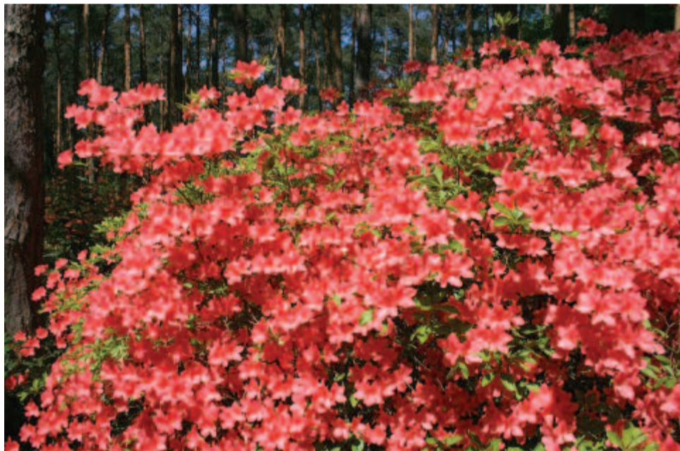
Rododendron május végi csodája

Ki alkotta a világot? Mért alkotta és hogyan? Benne ez a sok világögomb mért indul? Hová rohan? Miért van a Földön élet, s oly tömérdek alakban: légben, vízben, porban, sárban, egymás mellett és egymásban,