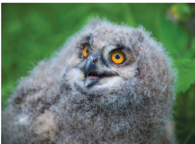
Fotó: Bodnár Boglárka (MTI)

Török László elmondta azt is, hogy az uhu, vagy más néven nagy fülesbagoly, a legnagyobb termetű bagolyfajta, Magyarországon fokozottan védett. Hozzátette: a Magyarországon költő párok száma évről évre kismértékben növekszik, melyhez hozzájárul a faj sikeres betelepítése az eredeti költőhelyeire. Ebben részt vállal a veszprémi állatkert is minden esztendőben. A nagy fülesbagoly éjjeli állat, de megfigyelték olyan példányokat is, amelyek nappal jártak zsákmány után. Rendkívül kifinomult látása és hallása segíti vadászatában. Táplálékát főként madarak és kisebb emlősök alkotják, melyeket horgas csőrével könnyedén elejt. Az Európában és Ázsiában őshonos uhu kerüli az emberlakta területeket, nehezen megközelíthető, fákkal borított vagy sziklás, szakadékokkal szabdaltszerű területeket választ élőhelyéül – mondta az igazgató. (MTI)