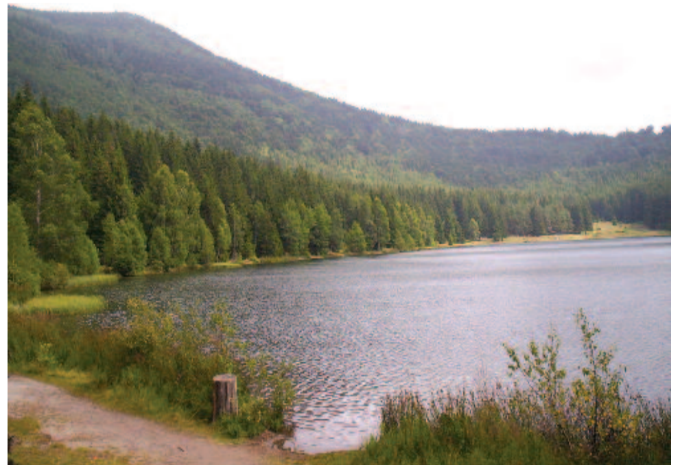
Szent Anna-tó

Úgy vélte ugyanakkor, hogy olyan megoldásokat kell találni, amelyek a környezetvédelmi szempontoknak és a turisták igényeinek is megfelelnek. Példaként említette, hogy amikor betiltották a tűzgyújtást a tóparton, egyes turisták az erdőben gyújtottak tüzet, hogy megsüssék a pecsenyéjüket, ezzel pedig még jobban veszélyeztették a tó környezetét. Ezért a terület gondnokaiként bölcsőbbnek látták engedélyezni, hogy a turisták